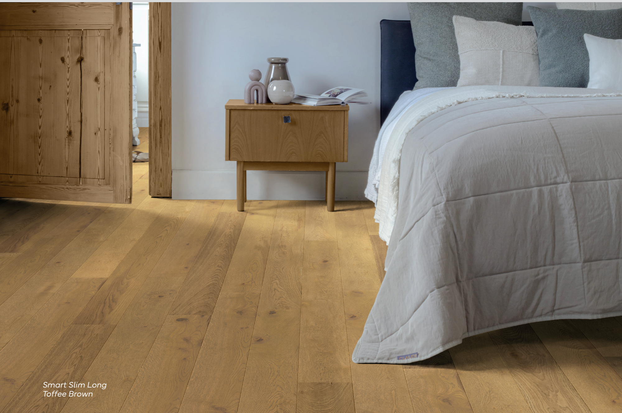
Smart Slim Long Toffee Brown