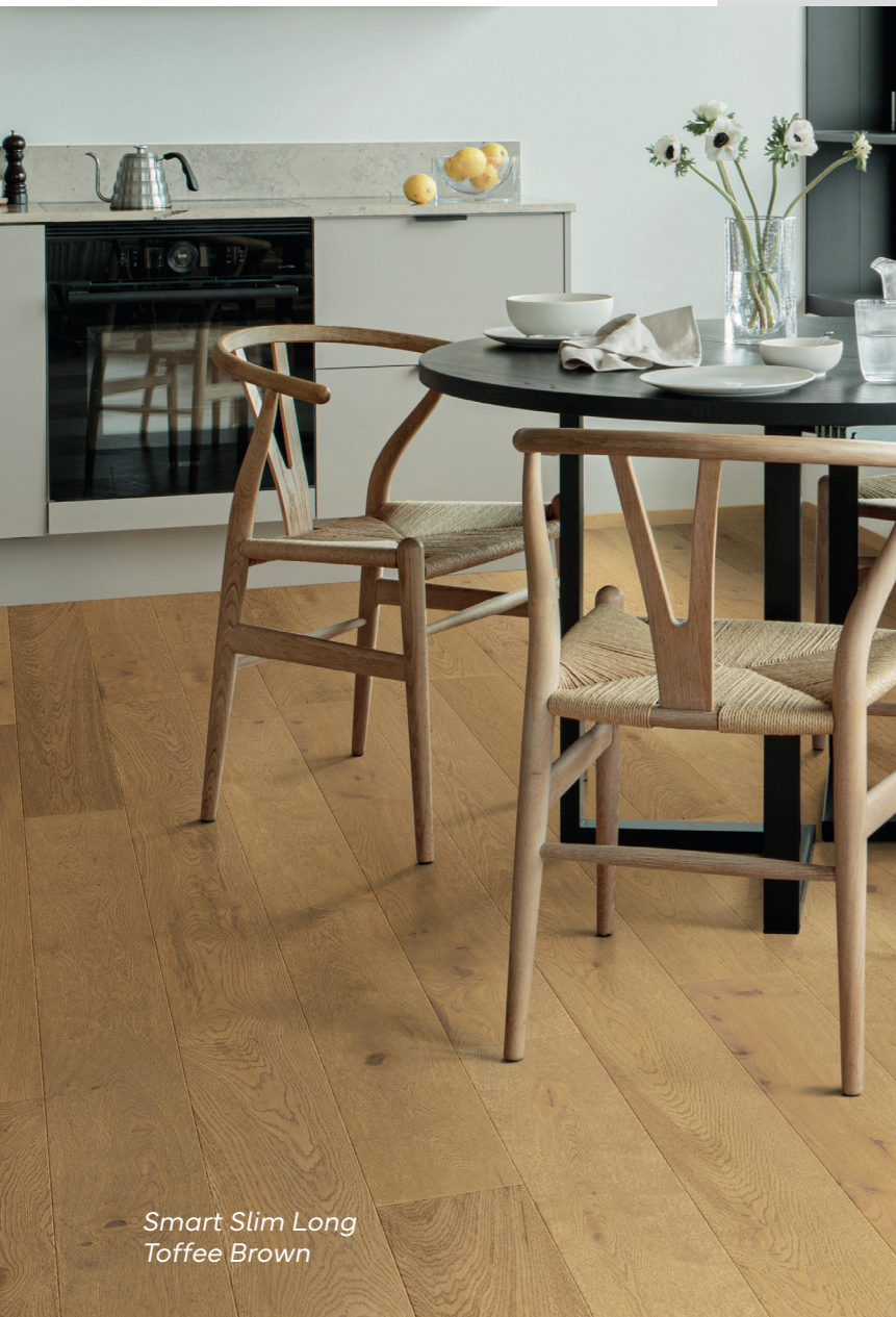
Smart Slim Long Toffee Brown