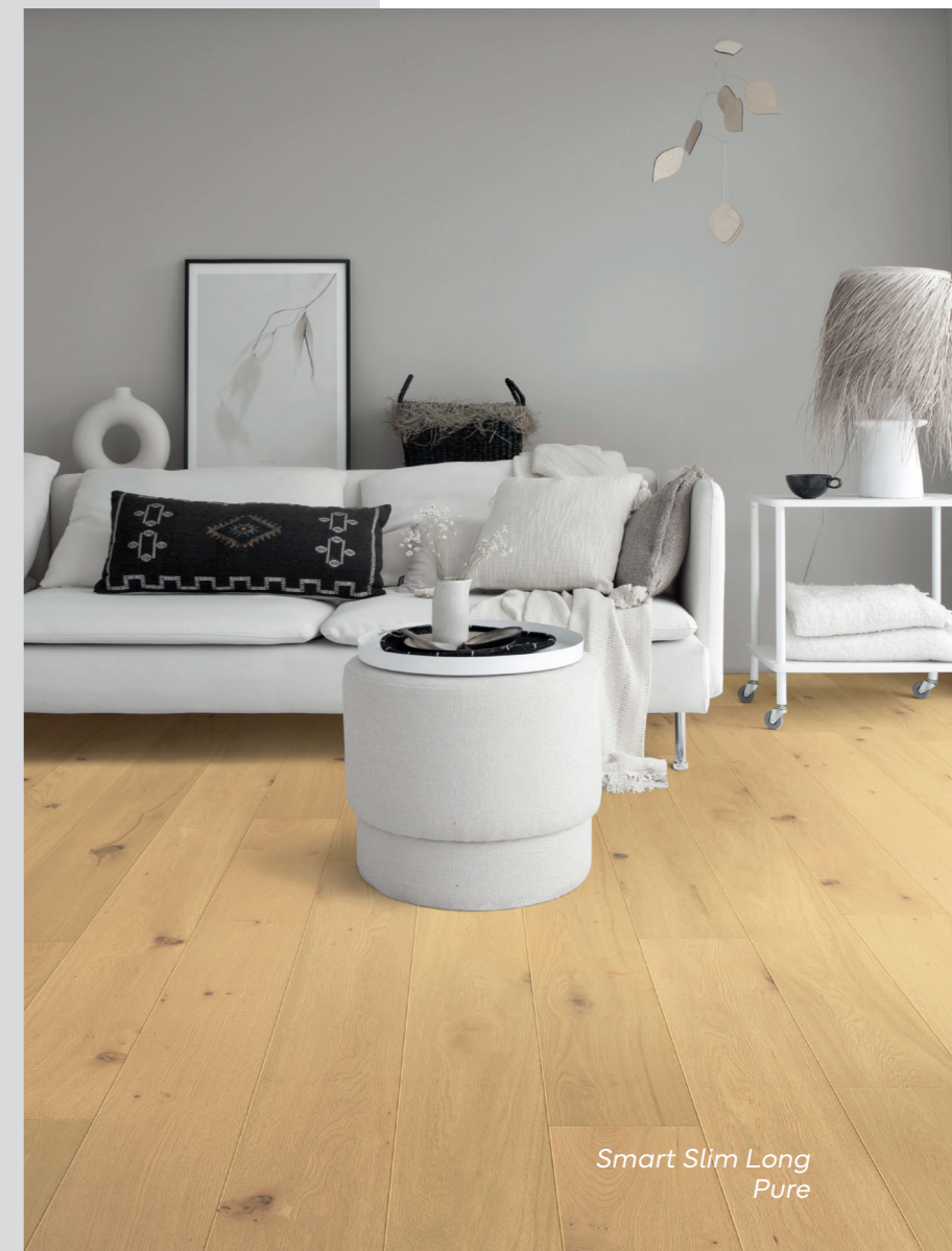
Smart Slim Long Pure

La nuova collezione 10 mm firmata Unilin che veste ogni ambiente. Lo strato nobile in rovere e il core in HDF uniscono in un solo prodotto tutta l'eleganza e la bellezza naturale del legno con la stabilità e la resistenza di un prodotto davvero tecnologico.