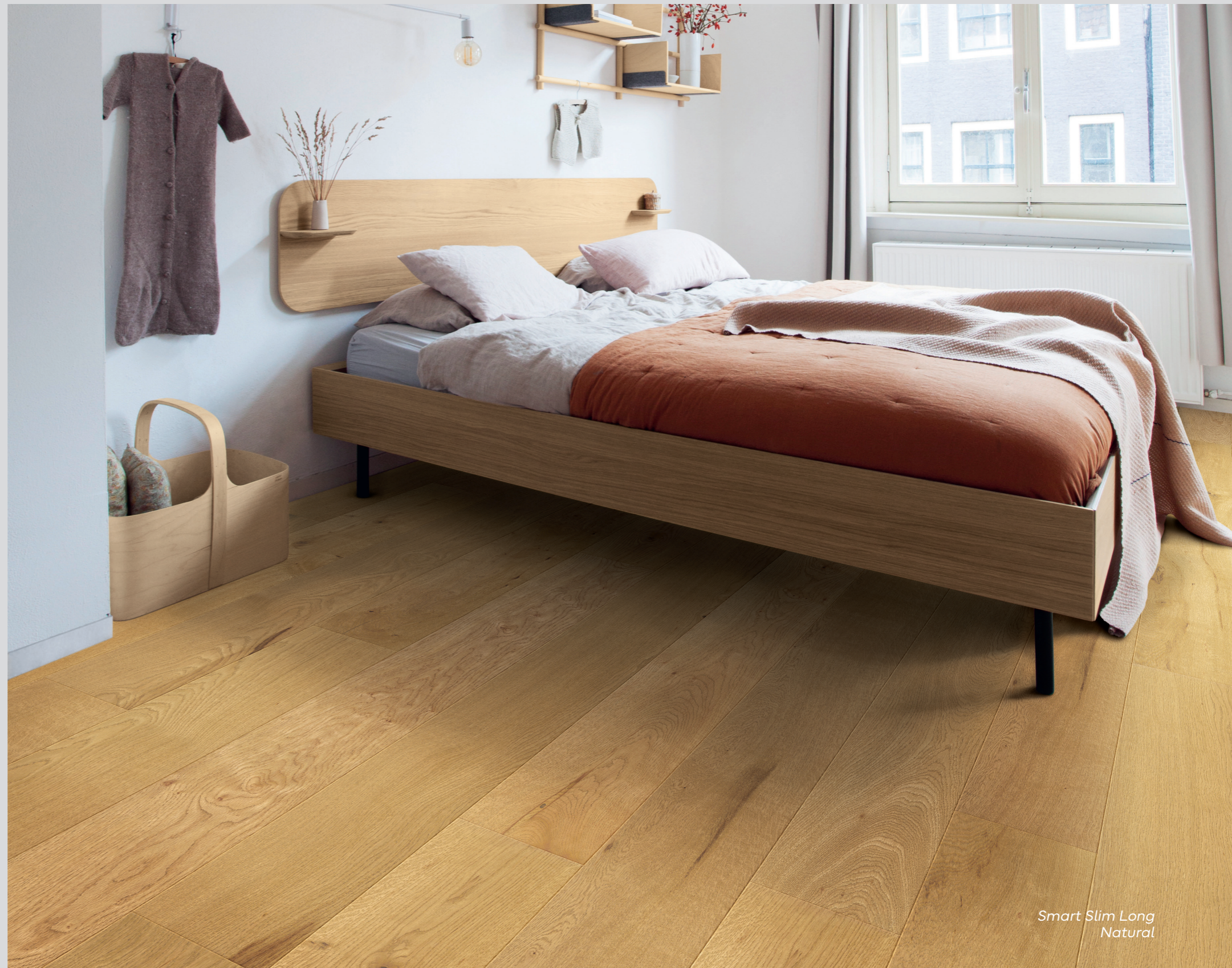
Smart Slim Long Natural